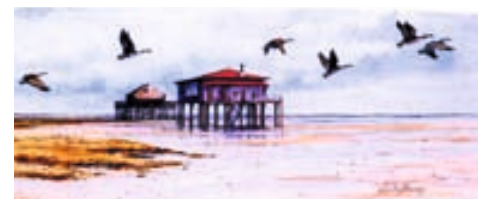
Aquarelle de Christian Bernard (6 ème dan)